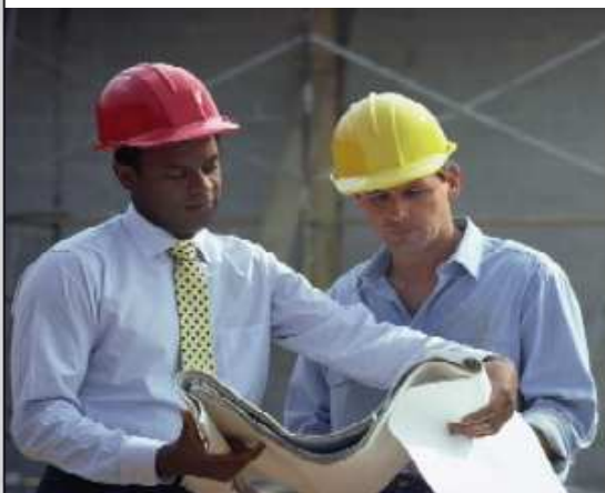
El project management se asienta como profesión.

Hace cinco años, el Máster en Dirección Integrada de Proyectos de Edificación (MeDIP) de la Universidad Politécnica de Madrid, con el patrocinio de AEDIP, era un formato inédito. Hoy la oferta se ha multiplicado por cuatro, tanto en la universidad pública como en la privada y, por su parte, el MeDIP, se ha convertido en la plataforma idónea para que los futuros profesionales se adentren de lleno en el mundo laboral.